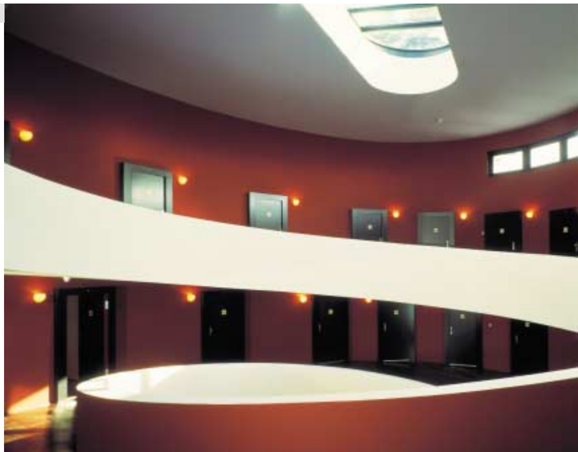
Hotel Zürichberg - ein dynamischer Neubau, der an das Guggenheim-Museum in New York erinnert.