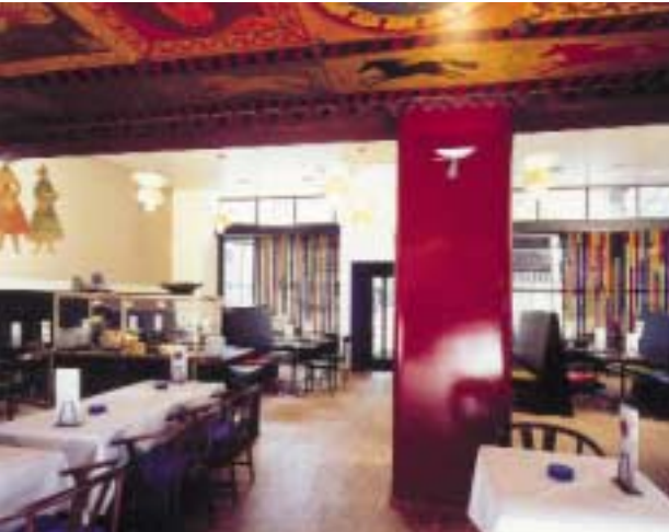
Restaurant Troika - ein Raum erzählt eine Geschichte.