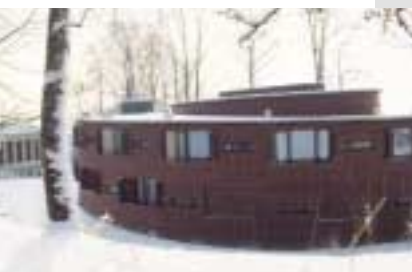
Als «Lampion» präsentiert sich das Hotel von aussen.